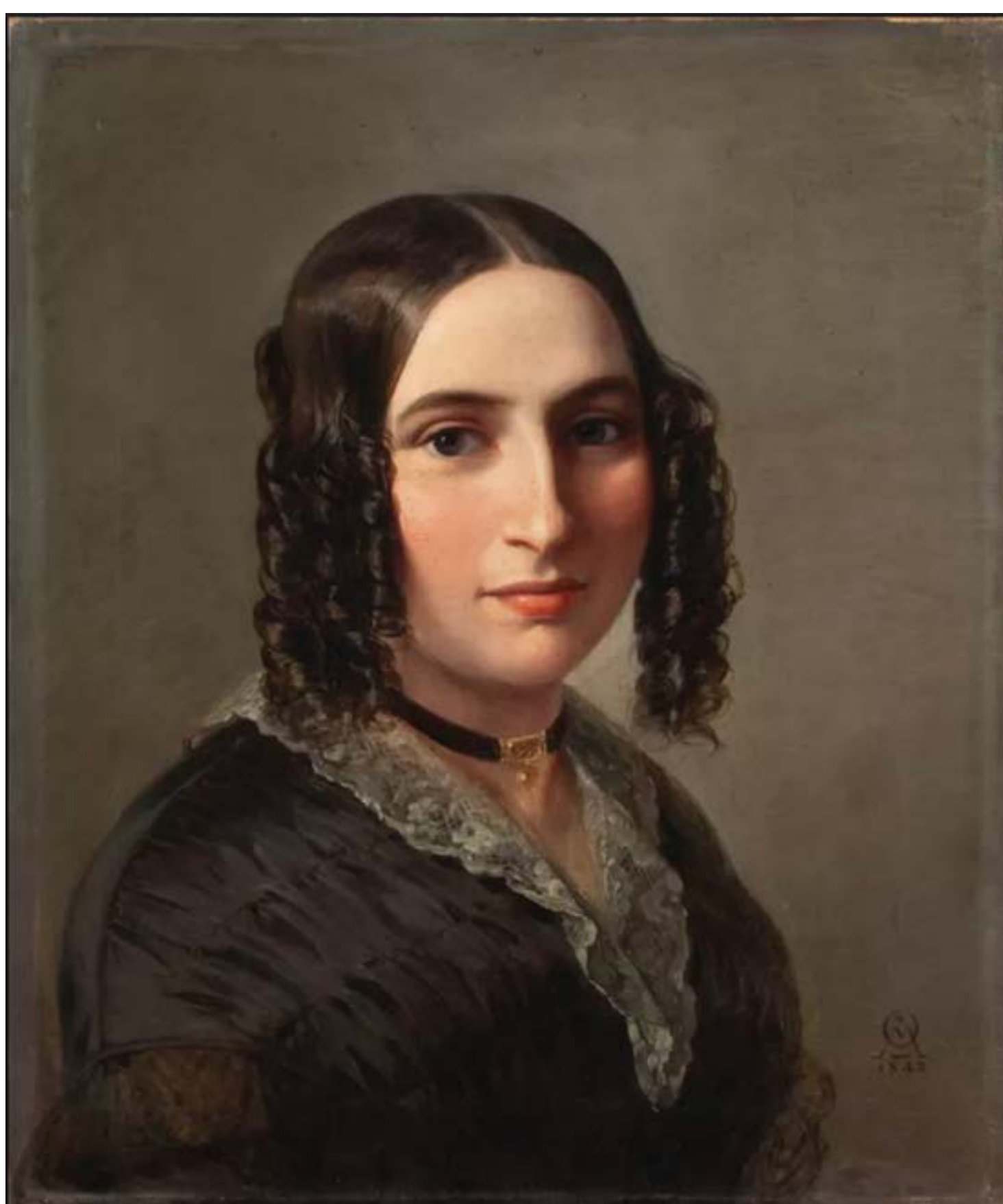
Moritz Daniel Oppenheim (1800-1882): Retrato de Fanny Mendelssohn, 1842. The Jewish Museum, Nueva York.

Este concierto contribuye a la resignificación del aporte femenino a las artes, especialmente a la música. Hacer visible, releer, romper paradigmas, salir de la violencia, eso y más nos exige nuestro tiempo, donde la seguridad y el bienestar de las mujeres se ven nuevamente amenazados.