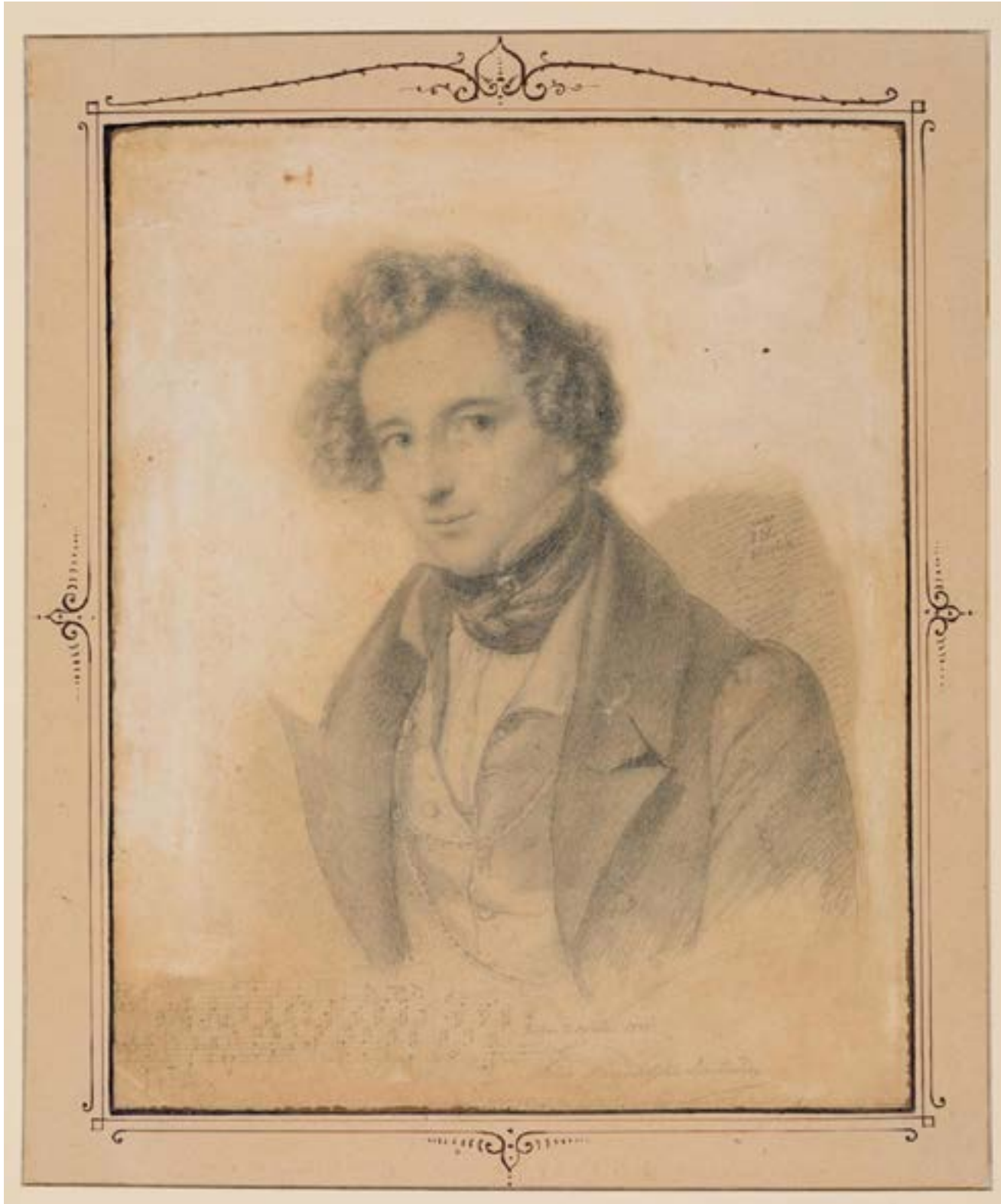
Eduard Bendeman (1811-1889): Retrato de Félix Mendelssohn, 1832. Colección Digital, Staatsbibliothek zu Berlín.