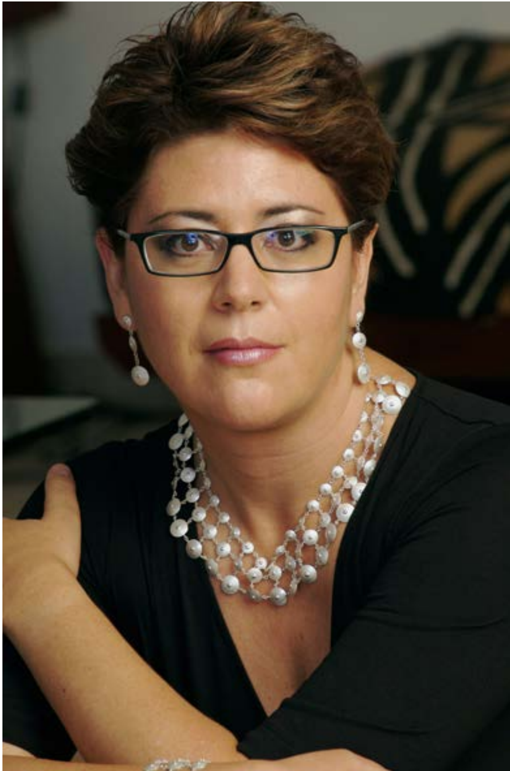
Gabriela Ortiz Composer (7 de marzo de 2022), Photos.