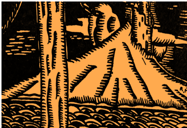
Roberto Montenegro, 1924

yo se disuelve en una unidad con el universo. Así, la noche y la obscuridad permiten la liberación de las cadenas que impone la conciencia del yo y, consecuentemente, permiten la unión con el ser amado sin división de tiempo y espacio. Estas son sólo algunas ideas contenidas en los Himnos de la Noche utilizadas por Wagner especialmente en el segundo