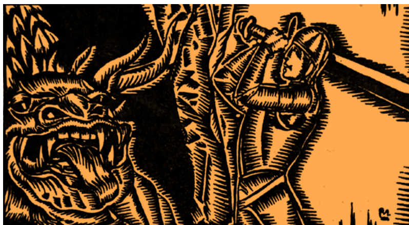
Roberto Montenegro, 1924

sentaciones pictóricas de diferentes escenas. Al respecto, recuérdense los tapetes tejidos por las monjas del convento cisterciense de Wienhausen, en Alemania o los tapetes Guicciardini del siglo XIV conservados en el Museo Nazionale de Bargello en Florencia y en el Victoria and Albert Museum de Londres. Después del siglo XIV la leyenda no tuvo una recepción significativa hasta su redescubrimiento en el siglo XIX, cuando fue tema de poemas, novelas y dramas. De toda esta