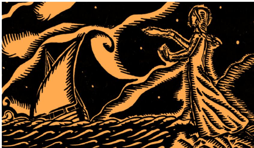
Roberto Montenegro, 1924

El origen de la leyenda de Tristán e Isolda es incierto. Si bien pertenece al ciclo de leyendas relacionadas directa o indirectamente con el rey Arturo y la tabla redonda, los investigadores han rastreado principalmente fuentes celtas y germanas. También una obra oriental ha sido considerada como posible origen de la leyenda, aunque tal hipótesis sólo se basa en algunos pocos elementos comunes. Tal como conocemos hoy la leyenda, se acepta que es producto de varias versiones y refundiciones diversas. En sus líneas muy generales, la leyenda cuenta la historia de Tristán, hijo del rey Riwalin de Lohnois, el cual muere en una batalla y cuyo deceso provoca la muerte de su esposa Blanscheflur, antes de que Tristán naciera. El niño es sacado del vientre de la madre muerta. Son muchas las vicisitudes por las que pasa el niño huérfano hasta descubrir que es sobrino del rey Marke, hermano de su madre. El rey Marke lo adopta como si fuese el hijo que nunca tuvo, porque nunca se casó. En una batalla, Tristán mata a Morold, que en algunas variantes de la leyenda es el tío de la princesa Isolda y en otras, como en el drama