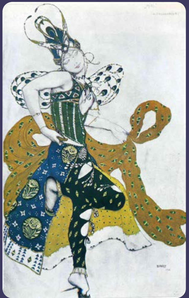
Boceto de vestuarios para el ballet La Péri (Léon Bakst, 1911)