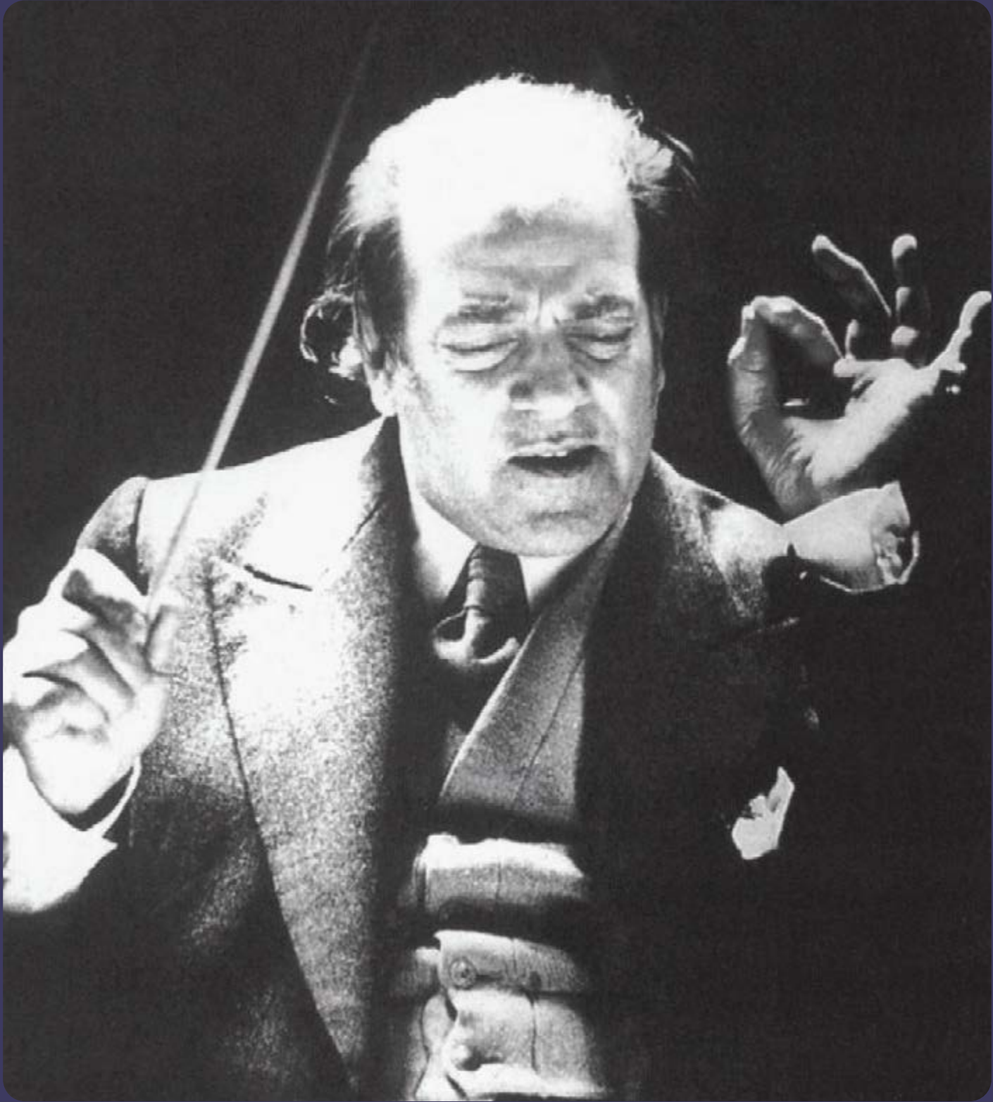
Heitor Villa-Lobos dirigiendo