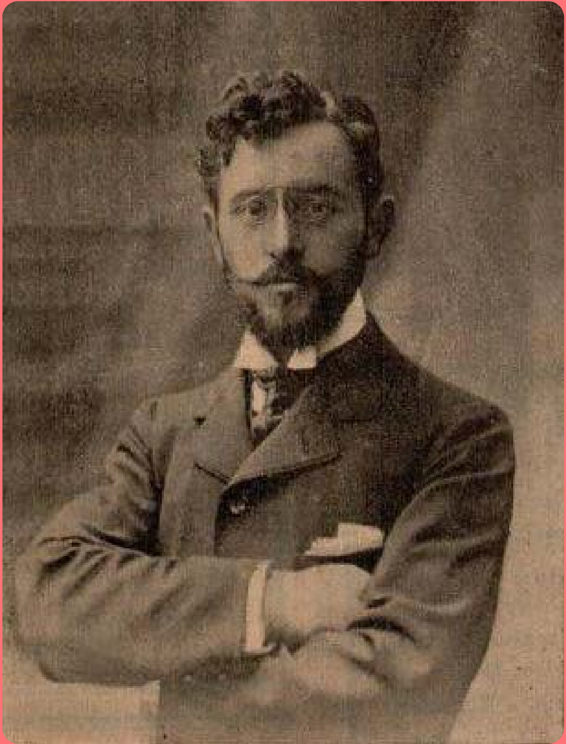
Florent Schmitt (1900)