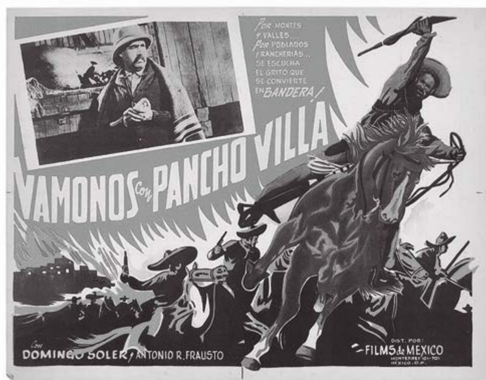
Cartel Vámonos con Pancho Villa (1935)

nos Sergio Guerrero (1921–2008) y Raúl Lavista Peimbert (1913–1980). Treinta años después de aquel estreno —cuando en la memoria popular ya se había instalado el estribillo « Que te ha dado esa mujer / que te tiene tan engreído / querido amigo, querido amigo / yo no se lo que me ha dado »— el también jalisciense Blas Galindo Dimas (1910–1993) utilizó la canción de Parra Paz para la composición de su Obertura Mexicana No. 2 (1981). La especialista en archivos sonoros Sibylle Hayem Laforet señala en su artículo El rescate de la música cinematográfica mexicana (2000) el olvido en el que ha caído esta tradición: « En la época de oro del cine se realizaban unas 200 películas al año y la orquesta trabajaba día y noche. Los compositores se especializaban en esta rama; es más, formaban parte del sindicato de la rama cinematográfica. Raúl Lavista musicalizó 360 películas, otros hasta 600... Conocemos a Manuel Esperón, pero también están Sergio Guerrero y Antonio Díaz Conde, Gustavo César Carrión, Enrico Cabiati, Luis Hernández Bretón, Jorge Pérez Fernández... Unos han muerto, otros, como el maestro Esperón, luchan desesperadamente contra el olvido, y Sergio Guerrero ya ni siquiera quiere volver a escuchar su obra. En la década de 1970 se sumaron a éstos los compositores clásico-contemporáneos: Blas Galindo, Eduardo Mata, Joaquín Gutiérrez Heras y Manuel Enríquez, entre otros. ¿Por qué entonces tanto desdén de la sociedad hacia los promotores de su cultura?».