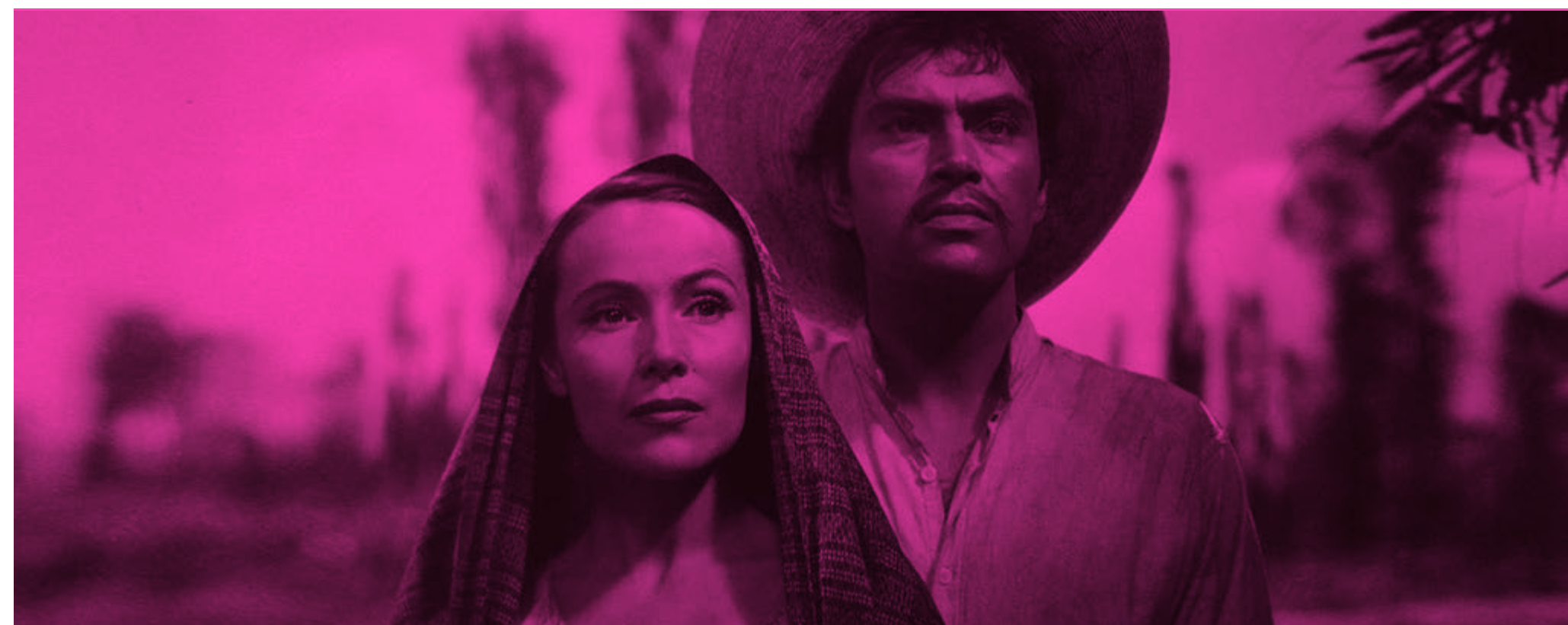
María Candelaria, 1943

gales, en su libro La música en el cine (2008) nos recuerda que «Las músicas que se utilizaban durante las proyecciones eran de estilos diversos y contrastados, incluso dentro de la misma película. Algunas de las grandes producciones disponían de una partitura propia, escrita expresamente para la ocasión, y algunos de los grandes nombres de la música de aquellos tiempos fueron autores de partituras cinematográficas: Camille Saint-Saëns, por ejemplo, escribió la música para L'assassinat du duc de Guise (1908) y Arthur Honegger fue el autor de la partitura con que se estrenó Napoléon de Abel Gance (1927). En ocasiones, como en el caso de la película de Gance, el dispositivo musical para los estrenos era espectacular: Napoléon se estrenó con toda solemnidad en la Opéra Garnier de París , con la participación de su orquesta, integrada por más de ochenta instrumentistas». Han pasado noventa y dos años desde aquella conmoción sonora-cinematográfica de finales de 1927 y la historia del cine sonoro ha pasado por múltiples altibajos y diversos usos estéticos y propagandísticos. No obstante, la inclusión del sonido y de la música en el cine ha enriquecido, en el mejor de los casos, un arte que disfrutamos cada vez con más realismo.