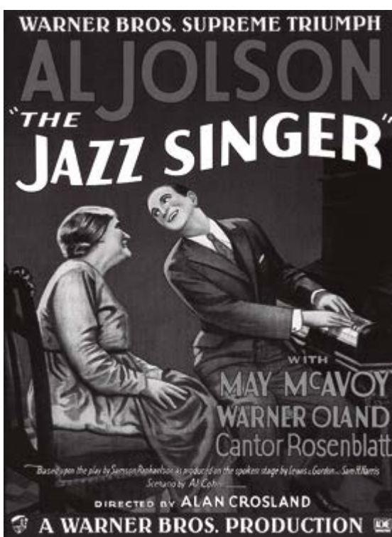
Cartel The Jazz Singer (1927)

La primera película de la historia con una banda sonora completa y efectos de sonido sincronizados fue Don Juan (1926) del neoyorquino Alan Crosland (1894-1936), la música sincronizada con las imágenes correspondían a fragmentos de la ópera de Mozart. Al año siguiente, Crosland dirigió Old San Francisco (1927) -donde introdujo por primera vez los ruidos y efectos sonoros- y la pionera del sonido sincronizado The Jazz Singer (1927), que utilizaba el primer sistema de sonido cinematográfico: el mítico Vitaphone , donde la banda sonora (música, sonidos, efectos) se grababa en discos que se reproducían de manera sincronizada con la película. La noche del estreno, el 6 de octubre de 1927 en Nueva York, el público embelesado con las canciones quedó estupefacto cuando el cantante y actor Al Jolson, desde su papel de Jack Robin, se dirigió al público y dijo: «Esperen un momento, pues todavía no han oído nada. Escuchen ahora».