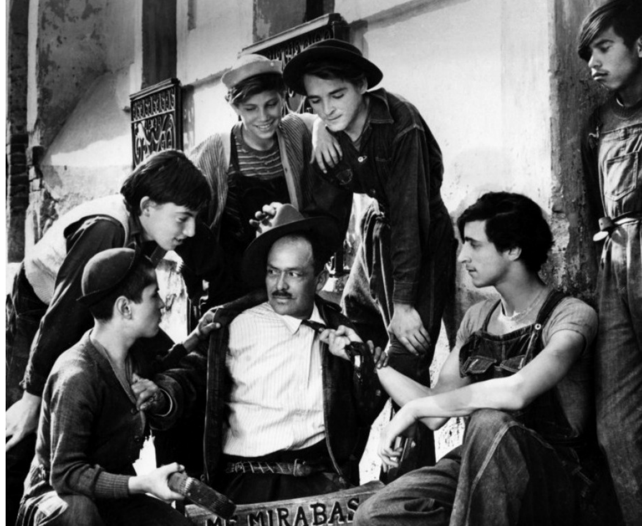
Los Olvidados (1950)

El novelista, dramaturgo y cineasta francés Marcel Pagnol (1895–1974) solía decir que « el film mudo era el arte de imprimir y difundir la pantomima y el film parlante es el arte de imprimir, fijar y difundir el teatro », para Pagnol el cine era teatro impreso en una cinta de celuloide; sesgada o no, la idea del francés recuerda a uno de los revolucionarios musicales y escénicos más discutidos, el alemán Richard Wagner (1813–1883), cuyo legado es tan amplio que no sólo alcanza a la música sino también al teatro, la escenografía, el ensayo, la interpretación mitológica, por mencionar sólo algunas áreas. Pero, indudablemente, lo que más ha trascendido es su invención del drama musical, producto culminante del romanticismo; la Gesamtkunstwerk u obra de arte total —combinatoria de música, danza, poesía, pintura, escultura y arquitectura—; y el uso de leitmotiv s como sonoros hilos conductores que enfatizan la acción en una escena. Este wagneriano cauce creativo ha desembocado, e influido naturalmente, en un arte donde la banda sonora ( soundtrack ) y la música incidental ( score ) apuntalan dramas contemporáneos y, donde eminentes compositores como Ennio Morricone, Hans Zimmer y John Williams musicalizan formas modernas de la ópera y el teatro: ese milagro que llamamos cine.