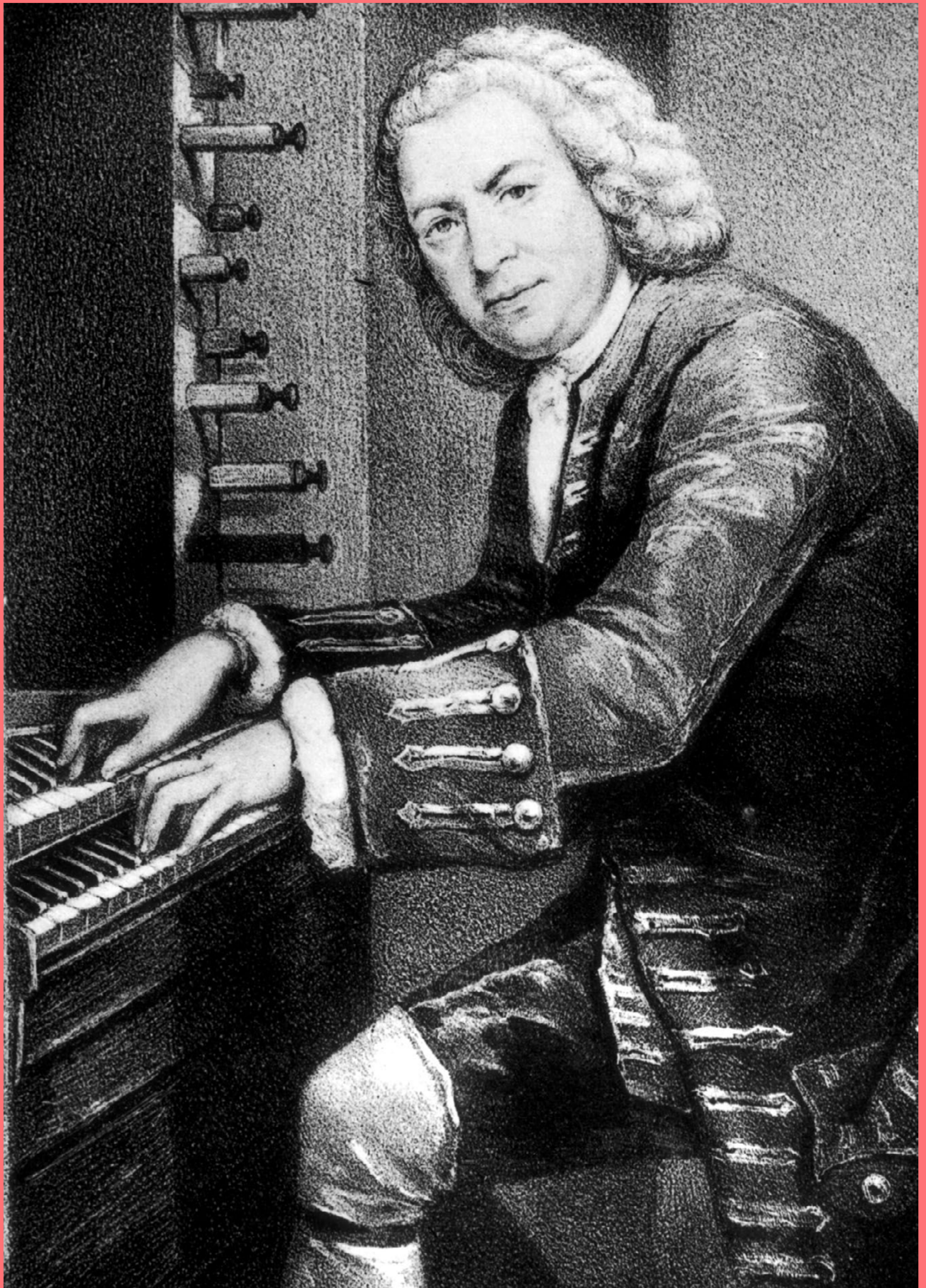
Johann-Sebastian-Bach al órgano (Autor desconocido, 1725)