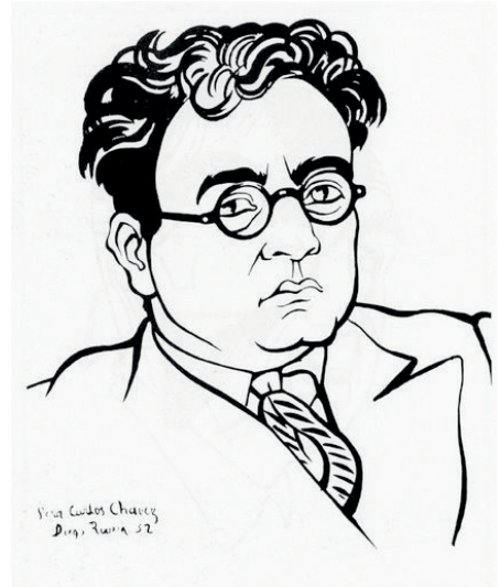
Carlos Chávez, por Diego Rivera, 1932

Creo que este es el inicio de la búsqueda de su voz compositiva, objetando la creación de las formas románticas utilizadas por la generación de fines del XIX e inicios del XX, aunque los lenguajes de Manuel M. Ponce, José Rolón y Julián Carrillo, entre otros compositores contemporáneos, también estaban en la búsqueda de un lenguaje nacional con características de la vanguardia centroeuropea, solo que Chávez se colocaba abiertamente como uno de los precursores de la nueva política cultural. Chávez es el orquestador de la