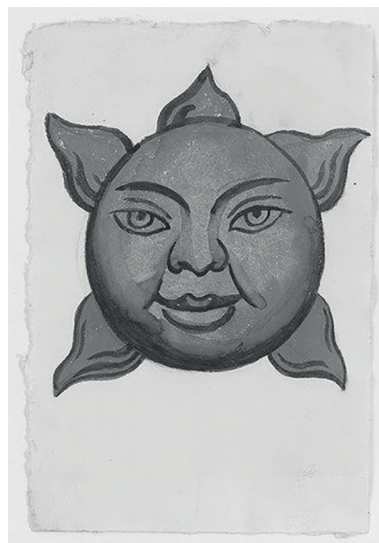
◀ Bocetos creados por Diego Rivera para Caballos de vapor , 1927